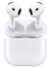
AirPods 4 avec Réduction active du bruit