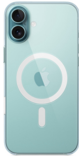
Coque transparente avec MagSafe pour iPhone 16 Plus