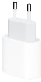
Adaptateur secteur USB-C 20 W