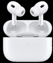
AirPods Pro 2