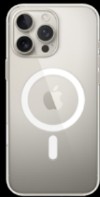
Coque transparente avec MagSafe pour iPhone 16 Pro Max