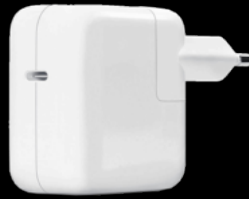
Adaptateur secteur USB-C 30 W