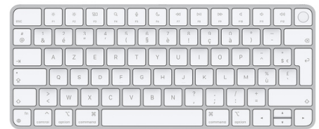
Apple Magic Keyboard avec Touch ID