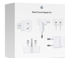
Kit de voyage Apple