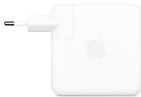
Apple adaptateur secteur USB-C 70 W