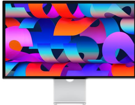
Apple Studio Display