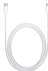
Câble de Charge USB-C (2 m)