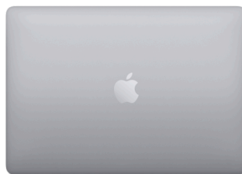
MacBook Pro 13 pouces