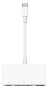
Adaptateur USB-C vers multiport VGA