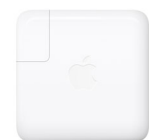
Adaptateur secteur USB-C 61 W