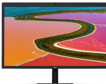
Moniteur 5k UltraFine LG