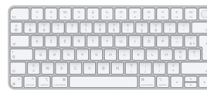
Apple Magic Keyboard avec Touch ID