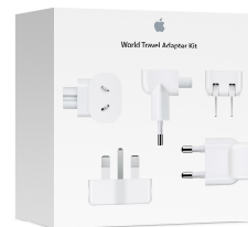
Kit de voyage Apple